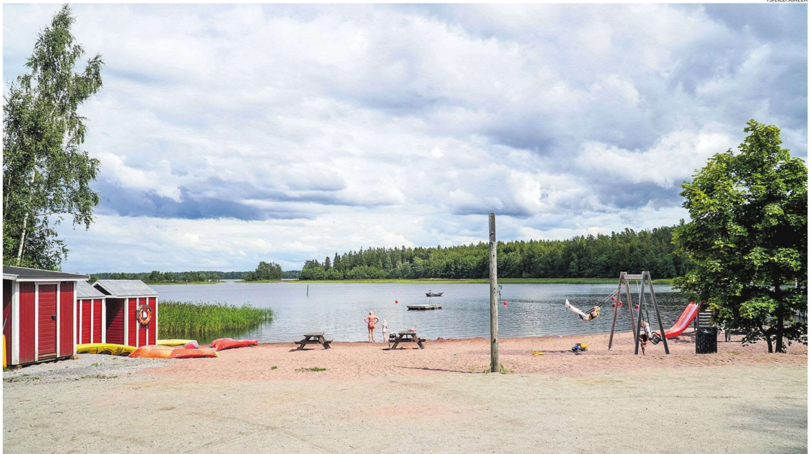
Pyhämaan Telakanranta on rauhallinen keidas, jossa voi viettää kesäpäivä uiden ja harrastan. Rannasta löytyvät muun muassa kahvila- ja saunapalvelut, välinevuokrausta, näyttelytilat sekä kulttuuriporoot, joilta avautuu näkymä saaristoon.

Pyöräilyharrastajat ovat ajaneet aamulla Uuteenkaupunkiin, josta he ovat lähteneet noin 50 kilometrin mittaiselle Velhoeden kierrokselle. Reitti mukaillee pakumatkailijan kiertorata.